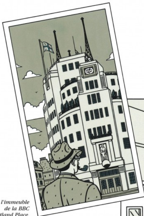
Devant l'immeuble de la BBC à Portland Place.