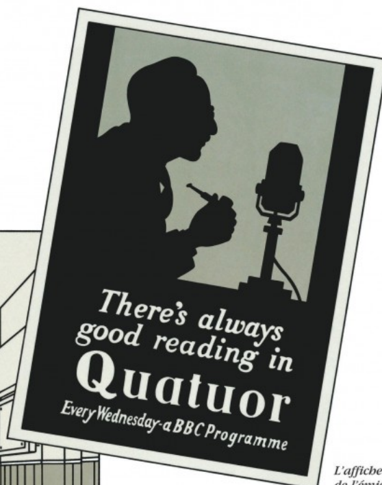
L'affiche de l'émission.