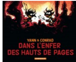
Dans l'enfer des hauts de pages