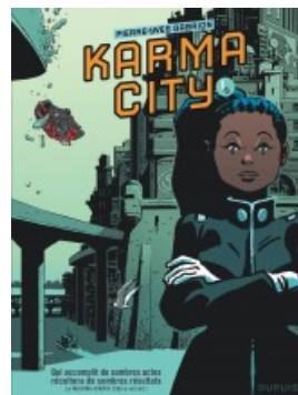
Karma City 1/2