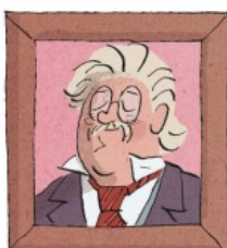
G. K. Chesterton

Président du Detection Club depuis sa création en 1930. Journaliste, essayiste, romancier, biographe, poète, ce monument des lettres anglaises est le père de l'abbé Brown, le célèbre prêtre détective.