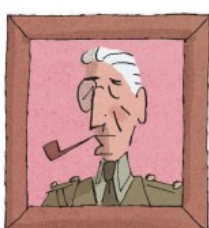
Le major A. E. W. Mason

La créatrice de Lord Peter, le détective aristocrate, est également une théoricienne du roman à énigme et contribue à promouvoir le genre en publiant des anthologies de nouvelles policières.