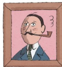
John Dickson Carr

La « duchesse du crime » qui a créé, dans le roman La Mystérieuse Affaire de Styles , en 1920, le détective belge Hercule Poirot, fameux dans le monde entier.