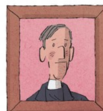
Le père Ronald Knox

Romancière, artiste et dramaturge d'origine hongroise, la baronne est la mère du Vieil Homme dans le coin , le détective immobile, et de Lady Molly de Scotland Yard .