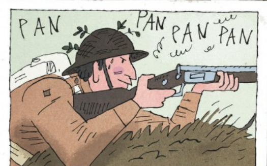
J'étais si exalté à l'idée de quitter mon unité que je me mis à tirer comme un shérif : vite et n'importe comment.