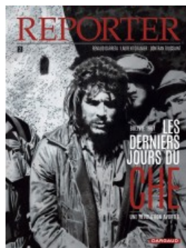
Les Derniers Jours du Che