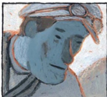
ET PUIS IL Y A HENRI CORNET, DIT «RIGOLO», QUI TRIOMPHA EN 1904 À L'ÂGE DE VINGT ANS ET COURT CETTE ANNÉE POUR LE GLOBE...