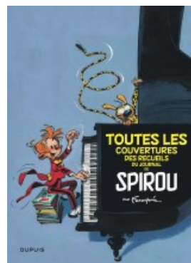
Toutes les couvertures des recueils du Journal de Spirou par Franquin