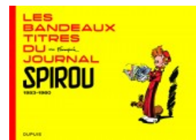
Les bandeaux-titres du Journal de Spirou - tome 1