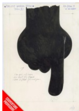
Et Franquin créa Lagaffe : entretiens avec André Franquin