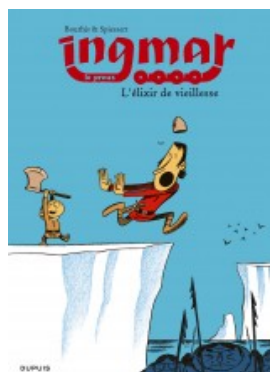
L'elixir de vieillesse