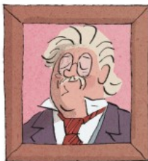
G. K. Chesterton Président du Detection Club depuis sa création en 1930. Journaliste, essayiste, romancier, biographe, poète, ce monument des lettres anglaises est le père de l'abbé Brown, le célèbre prêtre détective.