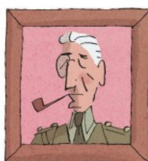
Le major A. E. W. Mason Célèbre pour ses romans d'aventures comme Les Quatre Plumes blanches , cet homme d'action au passé mouvementé a inventé l'inspecteur Hanaud.