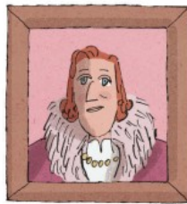
Agatha Christie La « duchesse du crime » qui a créé, dans le roman La Mystérieuse Affaire de Styles , en 1920, le détective belge Hercule Poirot, fameux dans le monde entier.