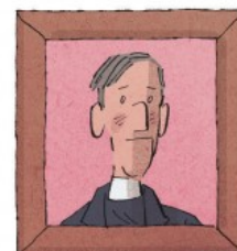
Le père Ronald Knox Premier prêtre à écrire des histoires policières, il est aussi l'instigateur des études holmésiennes avec son essai Études sur la littérature de Sherlock Holmes . Il a codifié les dix règles d'or du roman policier.