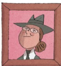
Dorothy L. Sayers La créatrice de Lord Peter, le détective aristocrate, est également une théoricienne du roman à énigme et contribue à promouvoir le genre en publiant des anthologies de nouvelles policières.