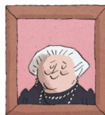
La baronne Emma Orczy Romancière, artiste et dramaturge d'origine hongroise, la baronne est la mère du Vieil Homme dans le coin , le détective immobile, et de Lady Molly de Scotland Yard .