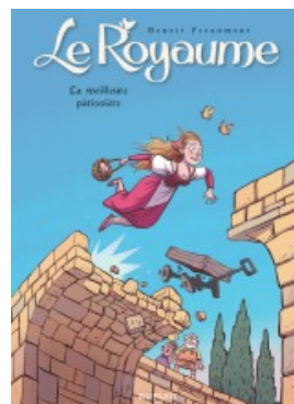
La meilleure pâtissière