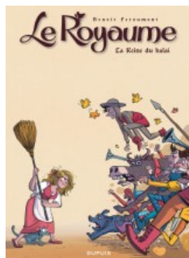
La Reine du balai