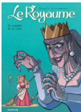
Le complot de la Reine T1/2