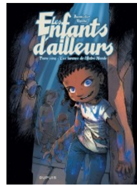
Les larmes de l'Autre Monde