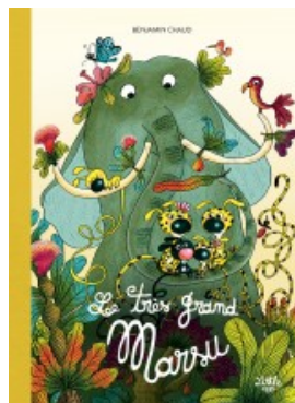
Le très grand Marsu