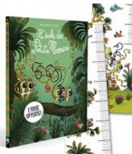
École des Petits Marsus