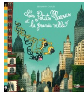
Les Petits Marsus et la grande ville