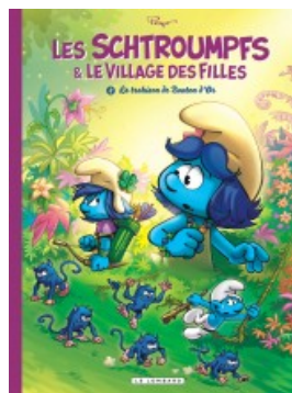
La Trahison de Bouton d'Or