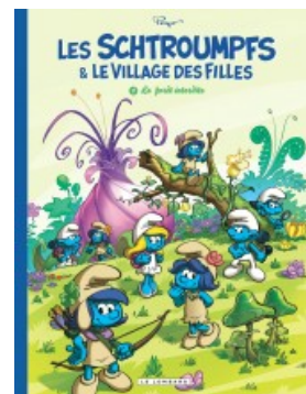
La Forêt interdite