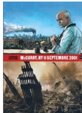
McCurry NY 11 septembre 2001