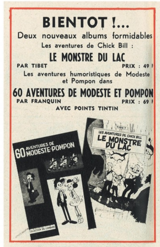
Publicité parue dans le n° 43 du journal Tintin de l'année 1958 (édition belge du 22 octobre 1958).