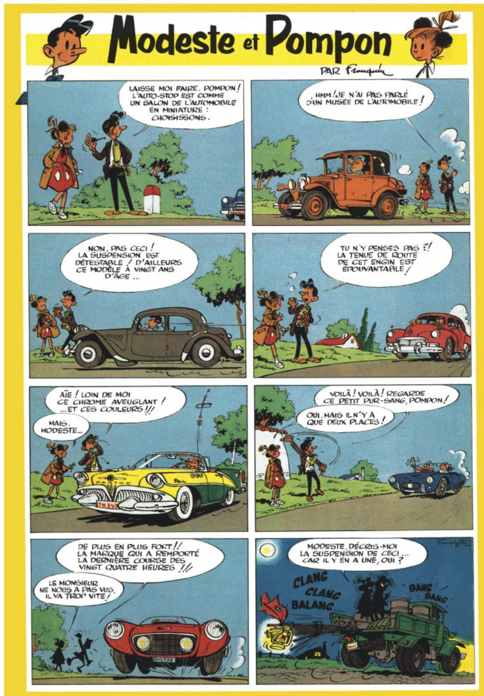
Premier gag de Modeste et Pompon tel qu'il est paru dans le journal Tintin n°42 de l'année 1955 (édition belge du 19 octobre 1955).