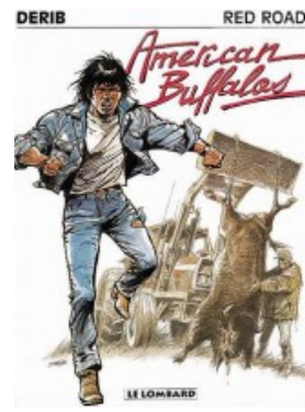
Red Road T1 : American buffalos