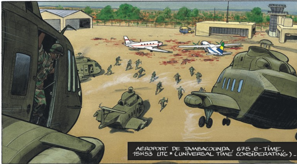
AÉROPORT DE TAMBACOUNDA, 675 e-TIME, 15H53 UTC * (UNIVERSAL TIME CONSIDERATING) -