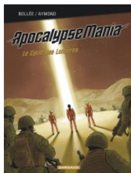
Apocalypse Mania – Intégrale Cycle 1