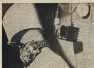
Cette montre est... un appareil émetteur-récepteur de radio, fonctionnant grâce à des transistors. Elle sera bientôt fabriquée en série par un industriel américain.

«Qui vous a envoyé?», etc., étaient de Delporte: c'était une complicité totale entre nous... Une idée comme ça, il faut un type qui sache rigoler? »