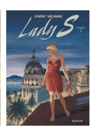
Lady S - Nouvelle intégrale - Tome 1