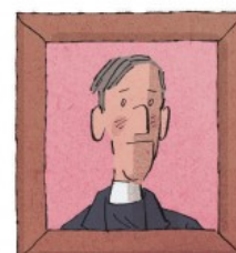
Le père Ronald Knox

Romancière, artiste et dramaturge d'origine hongroise, la baronne est la mère du Vieil Homme dans le coin , le détective immobile, et de Lady Molly de Scotland Yard .