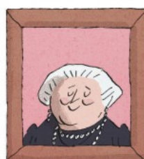
La baronne Emma Orczy

Célèbre pour ses romans d'aventures comme Les Quatre Plumes blanches , cet homme d'action au passé mouvementé a inventé l'inspecteur Hanaud.