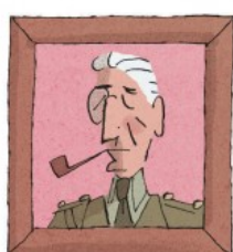
Le major A. E. W. Mason

La créatrice de Lord Peter, le détective aristocrate, est également une théoricienne du roman à énigme et contribue à promouvoir le genre en publiant des anthologies de nouvelles policières.