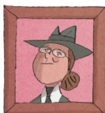
Dorothy L. Sayers

Un maître américain du roman policier et en particulier des énigmes « en chambre close ». Il vient de faire paraître Trois cercueils se refermeront , une enquête du Dr Gideon Fell.