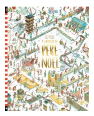
À la recherche du père Noël