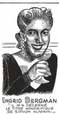
INGRID BERGMAN "IL M'A DÉCERNÉ LE TITRE HONORIFIQUE DE SIPHON HUMAIN."

"IL POSSÉDAIT 28 COSTUMES, TOUS IDENTIQUES. CHAQUE VESTE ET PANTALON ÉTAIENT NUMÉROTÉS POUR LE PRESSING." - NORMAN LLOYD