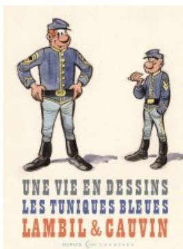
Lambil et Cauvin - Les Tuniques Bleues