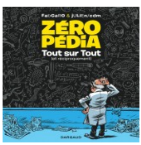
Zéropédia tome 1