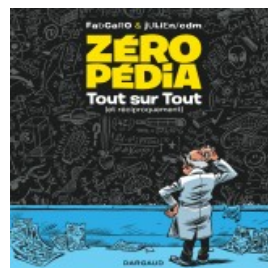
Zéropédia tome 1